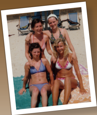
20 Bougies Mes premières Vacances aux Baléares

Je vous invite à fêter mes 50 Printemps et vous donne rendez-vous le : Samedi 1 er Mars 2008 à partir de 12H30