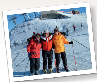
40 Bougies Mes classes de Neige

Veilles me prévenir en cas d'empêchement