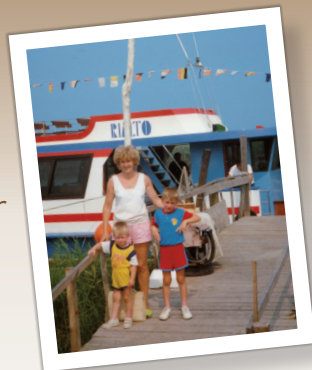
30 Bougies Séjour en famille à la Mer

Veilles me prévenir en cas d'empêchement